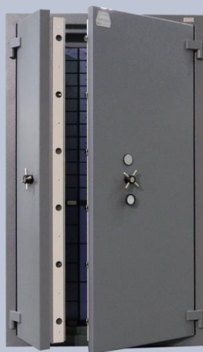
Cassaforte CT080Z con cassetta di sicurezza CT080Z with security boxes CT080Z avec compartiments clients