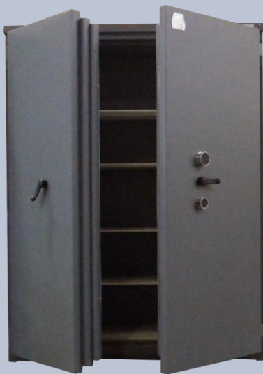
Cassaforte ET100L con ripiani ET100L with shelves ET100L avec étagères