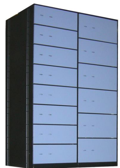
Semicolonna SDB 8 e SDB 6 Safe deposit boxes SDB8 and SDB6 Compartiments SDB 8 et SDB 6

Le système de montage permet leur substitution de manière rapide et économique.