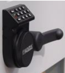
Serratura di sicurezza