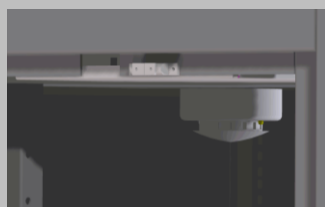
Sensori rilevazione fumi, calore, liquidi e vibrazioni