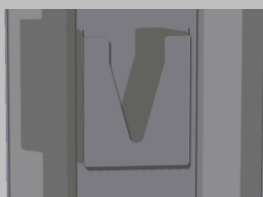
Tasca porta documenti